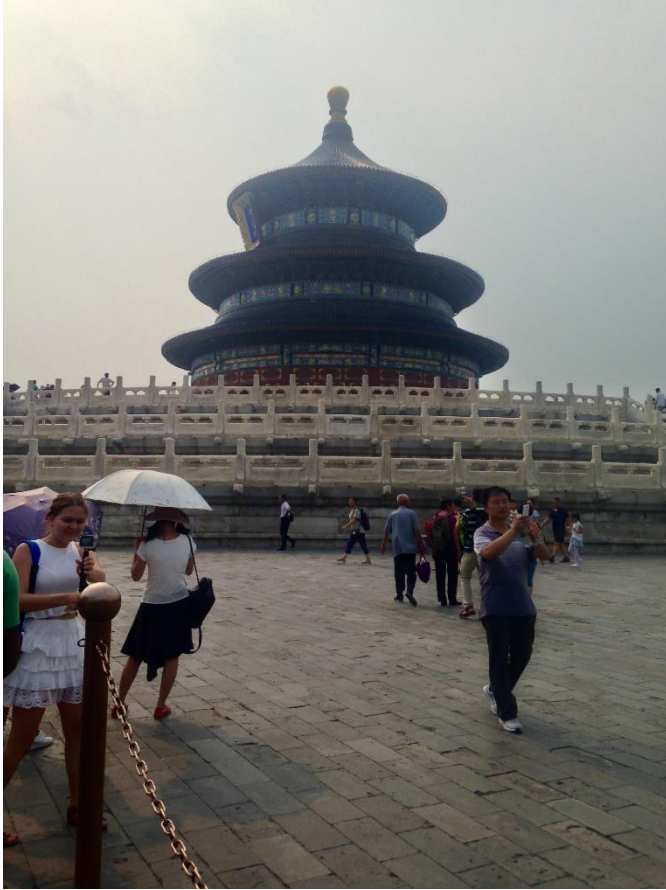
Temple of Heaven