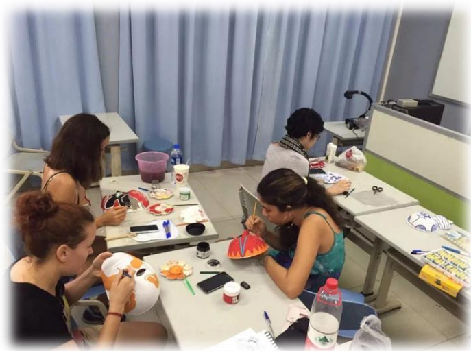
Atelier de création de masques d'opéra traditionnels chinois