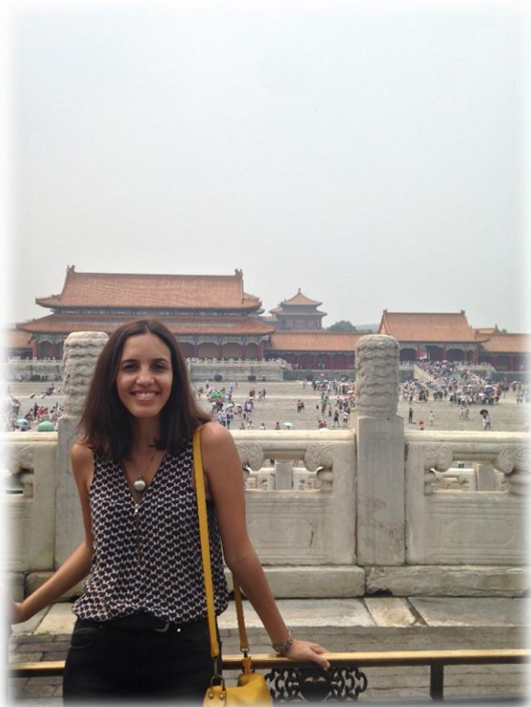
La Cité interdite