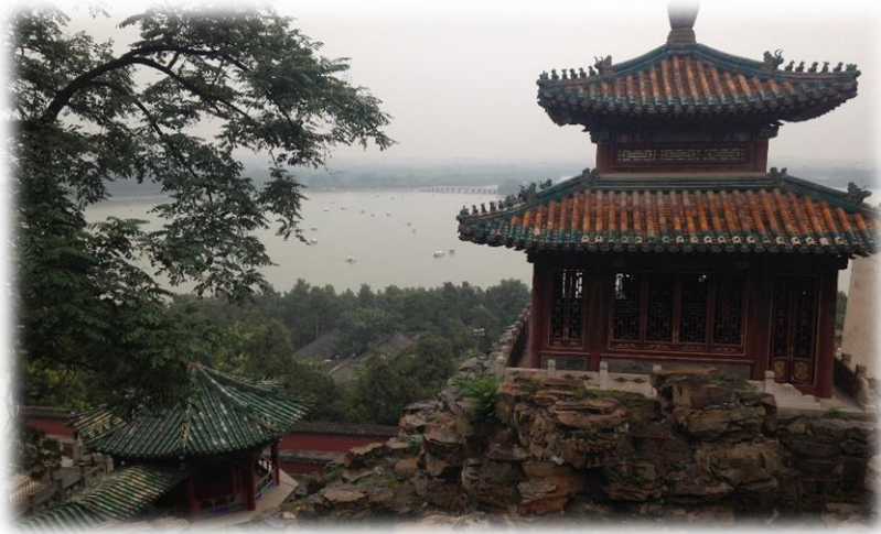
Le Palais d'Été