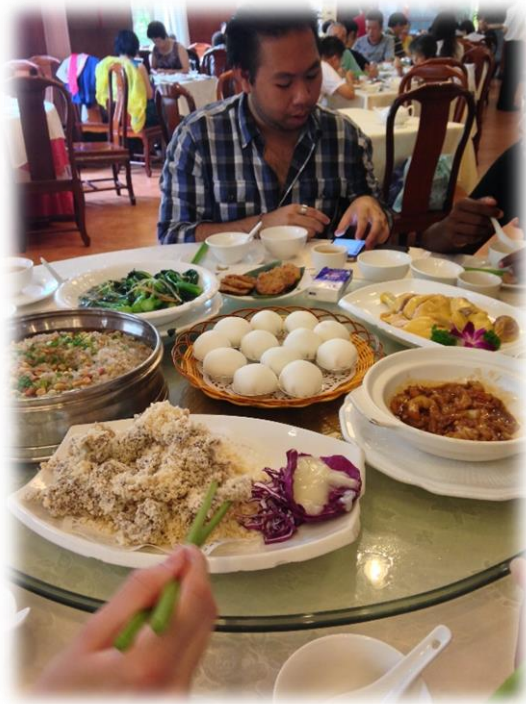
Découverte de la délicieuse gastronomie cantonaise